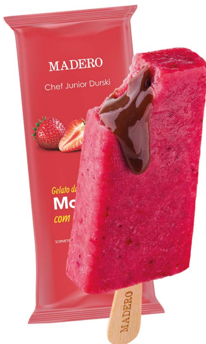
Gelato de Morango com brigadeiro