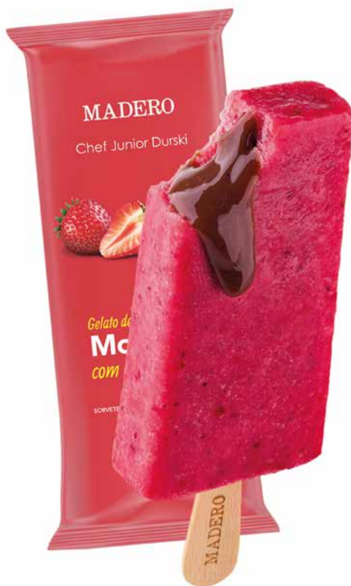
Gelato de Morango com brigadeiro