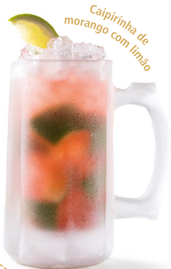
na caneca congelada